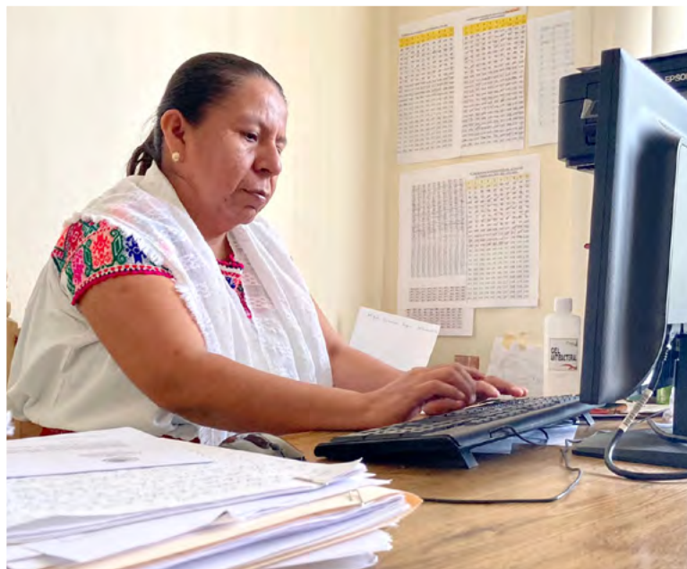
4. Jueza indígena suplente en Cuetzalan.

Pero especialmente la investigación etnográfica en los espacios de justicia, dando seguimiento a casos y su resolución, los esfuerzos de las promotoras de justicia por acompañar a mujeres detenidas y su participación en asambleas nos han permitido evidenciar las apuestas por construir una “justicia más justa” que considere a las mujeres y sus agravios, así como sus esfuerzos por generar diálogos con las autoridades (hombres) para considerar sus puntos de