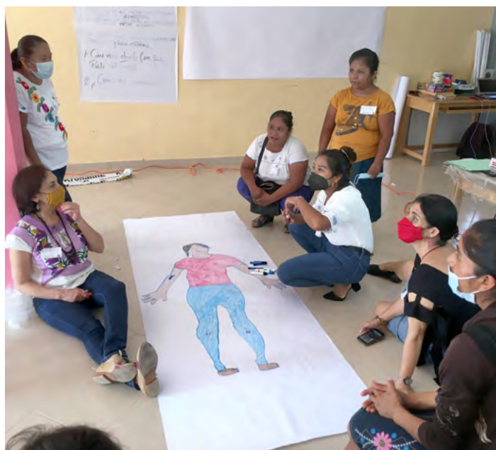
1. Taller “Violencias y Racismos en el Cuerpo”.

Mediante este texto, nos interesa compartir parte del trabajo que hemos hecho en este campo, destacando los aportes de una perspectiva de género y de diversidad cultural para el avance de la antropología jurídica crítica y, en especial, el papel de la investigación colaborativa. Para ello, ha sido fundamental el diálogo de saberes entre antropólogas comprometidas y mujeres indígenas organizadas, que, desde diferentes espacios colectivos y diversas estrategias textuales, han venido reflexionando sobre sus derechos como mujeres y como indígenas, incidiendo de mane-