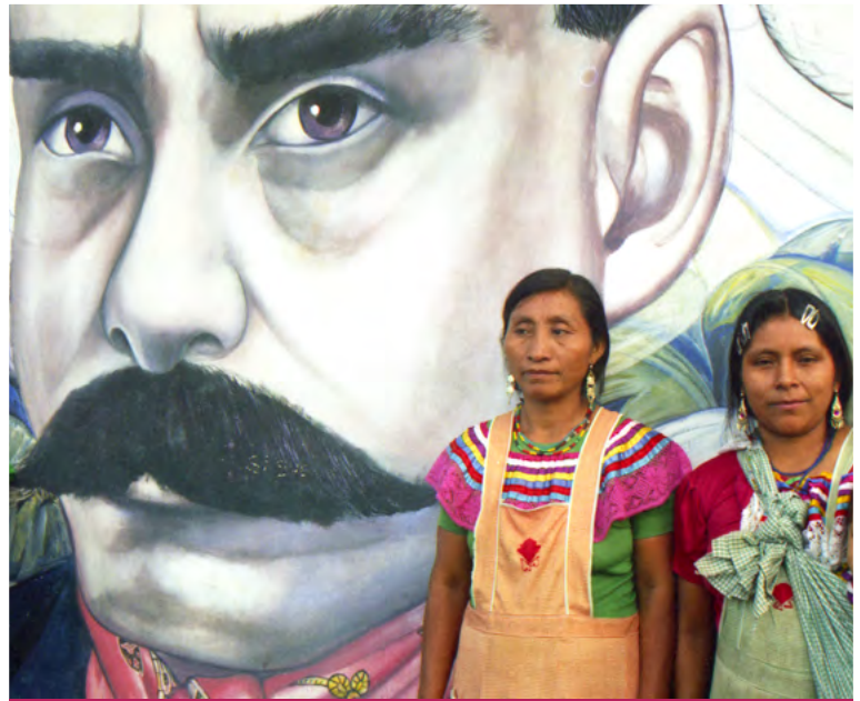
3. Mujeres zapatistas tojolabales.

Las nuevas estructuras y normatividades de la justicia zapatista se han consolidado como sistema de justicia autónomo en el que las mujeres indígenas tienen una participación muy importante. Mariana Mora en su análisis sobre el ámbito de la justicia zapatista da cuenta de cómo los zapatistas logran disputarle el poder al Estado al impartir justicia no sólo para las bases de apoyo zapatistas, sino también para la población no zapatista que recurre a ellos (véase Mora, 2022). Este nuevo sistema autonómico, mediante la