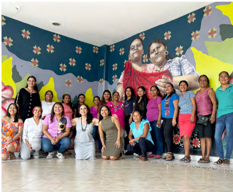
5. Investigadoras del CIESAS e integrantes de las tres casas de Ayutla en la Casa de los Saberes Gúwa Kúma.

Durante los últimos dos años (2021-2023), hemos desarrollado talleres, encuentros, conversatorios, etc., y analizado conjuntamente las múltiples violencias que afectan las vidas de estas mujeres, así como las violencias específicas que sufren las usuarias que recurren a los servicios del Centro Comunitario o a las instituciones de salud y de justicia estatales. Los testimonios documentados dan cuenta de la manera en que los racismos institucionales se manifiestan, en especial en los ámbitos médico, de justicia y laboral. Los efectos del racismo han sido ubicados en su cuerpo, en la manera en que los tratos discriminatorios las enferman, las afectan emocionalmente y, en muchos casos, ponen en peligro su vida cuando se les niega el servicio médico en situaciones de emergencia, sobre todo en casos de embarazo y parto.