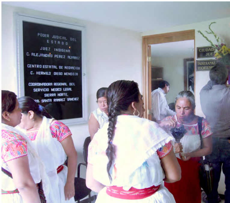
2. Inauguración de un juzgado indígena en 2010.

ofrece nuevos lenguajes con el fin de exigir una justicia de género como mujeres indígenas (Sieder, 2014; Sierra, 2014; Sieder y Sierra, 2011).